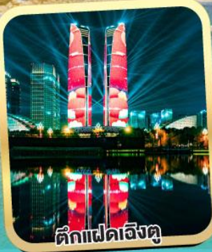
ตึกแฝดเิ่งตุ