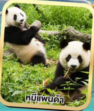
หมีแพนด้า