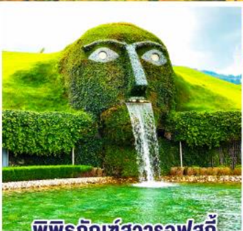
พิพิธภัณฑสถานสวิส