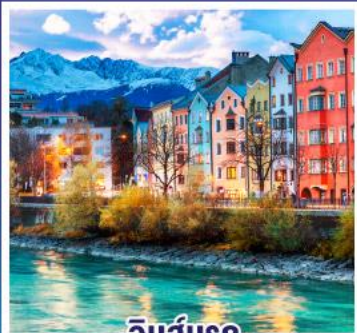
อินส์บรุค