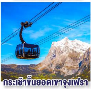
กระเช้าขึ้นยอดเขาจุงเฟรา