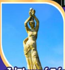
จูไห่พิชเซอร์กิส