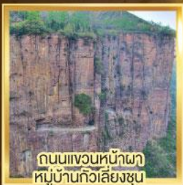
ถนนหน้าผาหมู่บ้านกัวเหลียงซุน