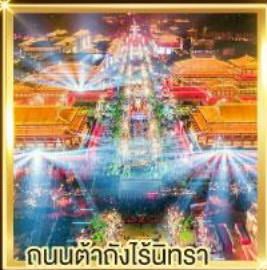
ถนนตัดถึงโธ่เกี๊ยะ

เดินทางสู่ "จหยวน" หรือที่ราบภาคกลางอันเป็น "อารยธรรม" สัมผัสสุดกำเนิดของมหาจักรวรรดิ, ต้นธารแห่งปรัชญาความเชื่อ