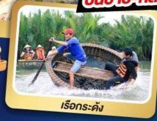
เรือกระดัง