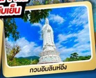
กวนอิมลินห์ฮิ่ง