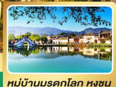
หมู่บ้านผดกโลก หงซุน