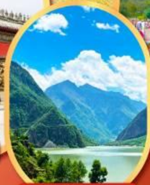
ทะเลสาปเต๋ยซี