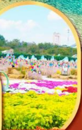
สวนสวรรค์แห่งคอกโม Manhua Manor