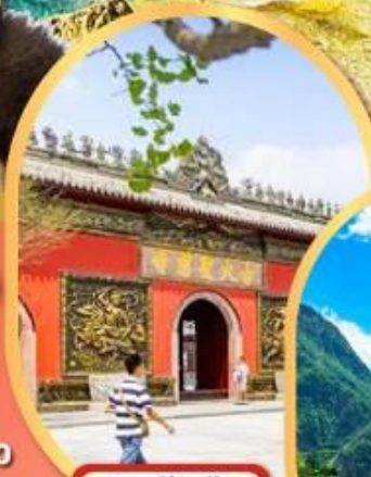
วัดต้าจื่อ