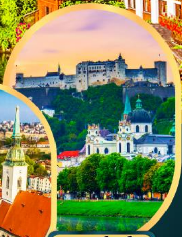
ซาลซ์บูร์ก