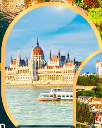
ล่องเรือแม่น้ำดานูบ