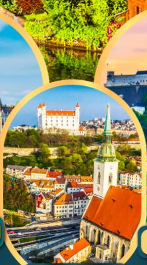
บราติสลาวา