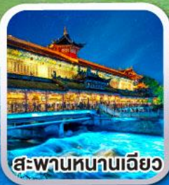
สะพานหนานเฉียว