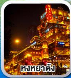
หงหยาดัง