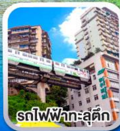
รถไฟฟ้าทะลุคิก