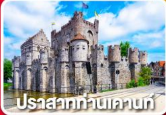
ปราสาทท่านเคานท์