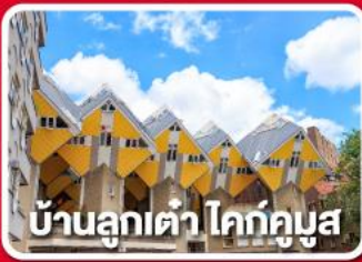
บ้านลูกเต่า โคกคูนูส