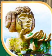
โมนาน่า ซาปา คาฟ