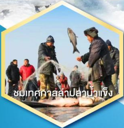
ชมเทศกาลปลาปลาน้ำแข็ง

ฟรี ถุงมือ หมวก ผ้าพันคอและถุงร้อน ท่านละ 1 ชุด !!