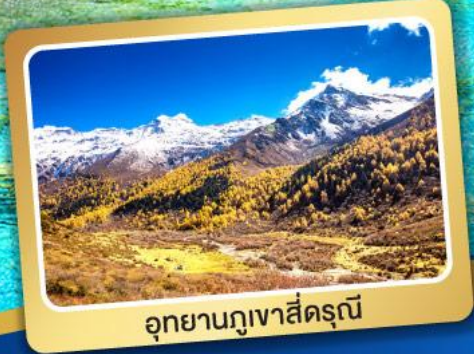
อุทยานภูเขาสี่ดรุณี