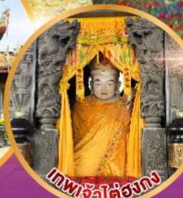
เทพเจ้าไต่ถ้องกง