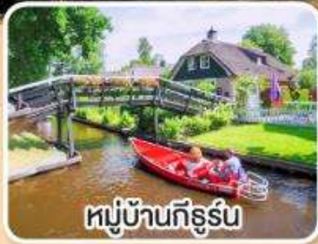
หมู่บ้านกิธูร์น