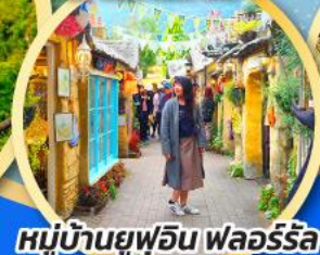
หมู่บ้านยูฟูอิน ฟลอร์ริล