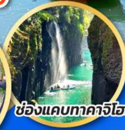
ช่องแคบทาคาจิโฮะ

อิสระ ช้อปปิ้ง 1 วันเต็ม ในเมืองฟุกุโอกะ