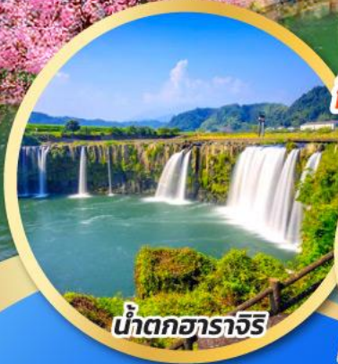
น้ำตกอาราจิริ