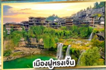
เมืองฝูหลงจั้น