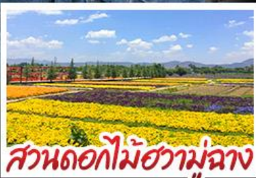
สวนดอกไม้ฮวาบูฉาง