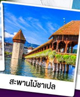
สะพานไม้ชาเปลา