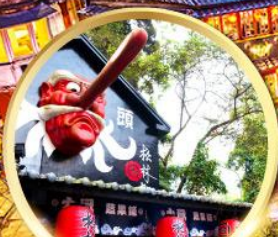
หมู่บ้านปิสางชิโก