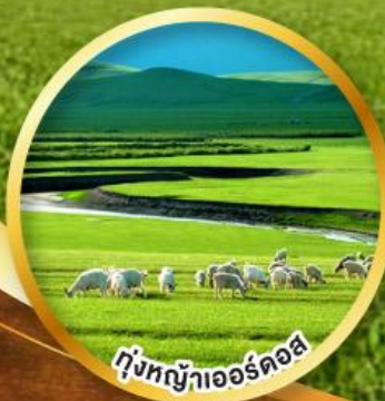
ทุ่งหญ้าเออร์ดอส