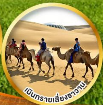
เบ็นทรายเสียงชาวน