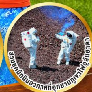
อณูโลกบินอวกาศที่อุทยานภูเขาไฟอูลันฮาตา