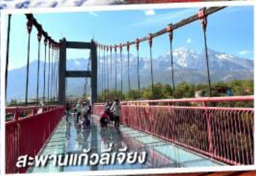
สะพานแก้วลี่เจียง