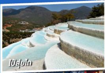
ไป๋ยู่โต

เที่ยวครบทุกไฮไลต์ • ไม่ลงร้านช้อปปิ้ง • พักโรงแรม 4 ดาว