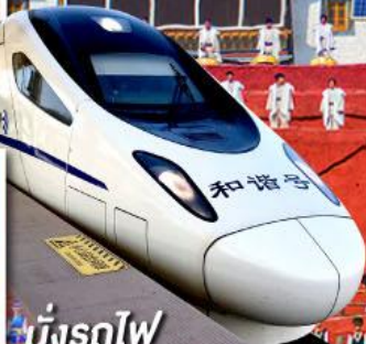
นั่งรถไฟ ความเร็วสูง