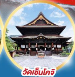
วัดชินโคจิ