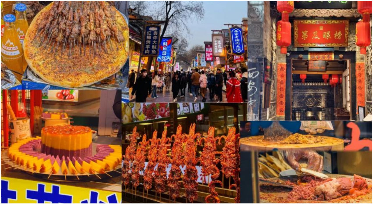
กลางวัน รับประทานอาหารกลางวัน ณ ภัตตาคาร (มือที่ 2)

ขายอาหารฮาลาล เครื่องเทศหอมกรุ่น เต่าอย่างเคบับเนื้อและแกะแบบสด ๆ ชามเนื้อวัวตุ๋นในซุปลีที่เดือด ควันพุ่งไม่หยุด ขนมพื้นบ้านที่ผสมสูตรโบราณกับวิถีชีวิตของผู้คนที่นี่ นอกจากความอร่อย ยังมีสียิดเก่าแก่หลายแห่งที่ซ่อนอยู่ในตรอกซอย ที่เปรียบดังหัวใจของครัทธา และ การอยู่ร่วมกันของวัฒนธรรมจีนและมุสลิมอย่างสงบมาเนิ่นนาน