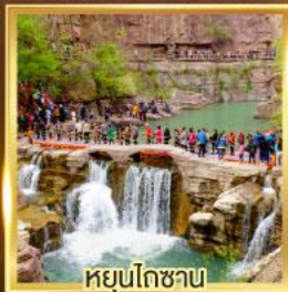
หยุ่นโกซ่าน