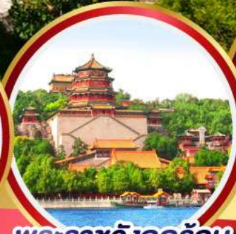
พระราชวังฤดูร้อน อู่เหอหยวน