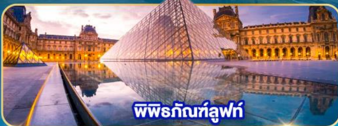
พีพริกันท์ลูฟท์