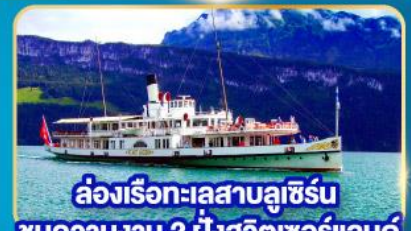
ล่องเรือทะเลสาบลูเซิร์น ชมความงาม 2 ฝั่งสวิตเซอร์แลนด์

พิเศษ! เข้าชมภายในพีพริกันท์ลูฟท์ พีพริกันท์ทางศิลปะที่มีชื่อเสียงที่สุดในโลก