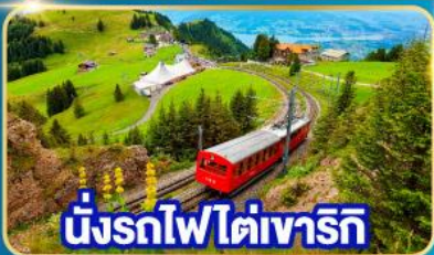
นั่งรถไฟใต้เขาริกิ