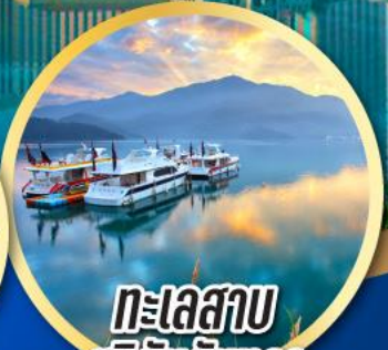
ทะเลสาบ สุริยันจันทรา

เมนูพิเศษ!! ต้มซำสโตล์ฮ่องกง เป้าอ้อ+ไวน์แดง, ปลาประรานาโรบคี้