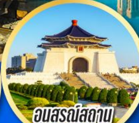
อนุสรณ์สถาน เจียงไคเช็ค