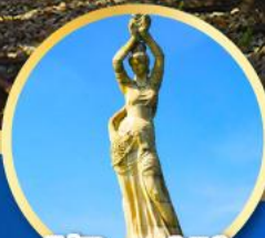
จูไห่ฟิชเชอร์เกิร์ล