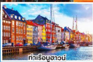
ท่าเรือฮาวน์

เดินทาง 19-26 พ.ย. 67 03-10 ธ.ค. 67 26 ธ.ค. 67-02 ม.ค. 68 (ปีใหม่)