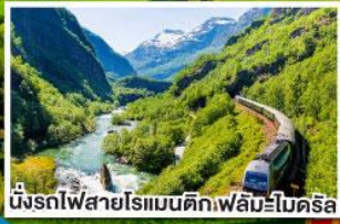
นั่งรถไฟสายโรแมนติกที่ฟลัมโบโร