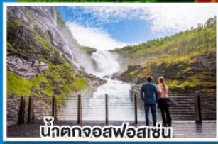
น้ำตกจอสฟอสเซ่น