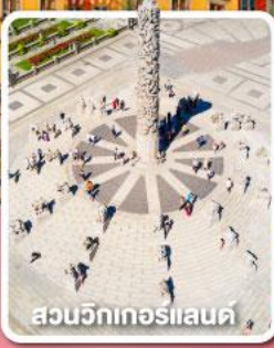
สวนวิกเตอร์แลนด์