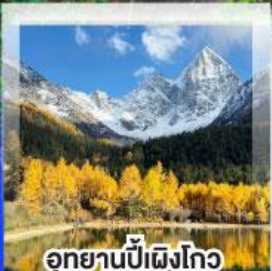
อุทยานปีผิงโกว