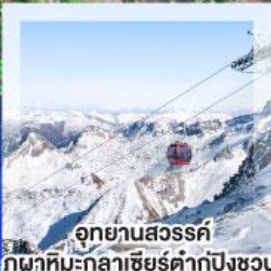
อุทยานสวรรค์ ภูผาหิมะ-กลาเซียร์ตำกู่ปิงชวน