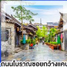
ถนนโบราณชอยกวางแคบ