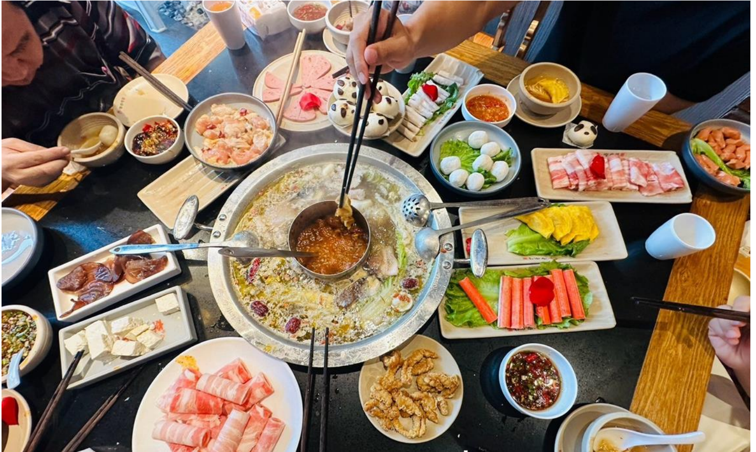
กลางวัน รับประทานอาหารกลางวัน ณ ภัตตาคาร (เมื่อที่ 17) *เมนูพิเศษสุกี้หม่าล่าเสฉวน