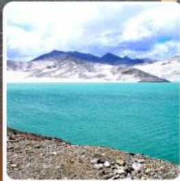
ทะเลสาบคาราคูล