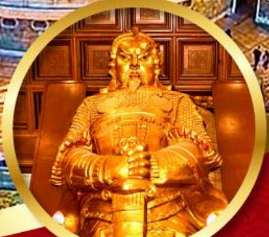
วัดแซงหนิว ขอพรโชคลาภ การเงิน และ ธุรกิจ