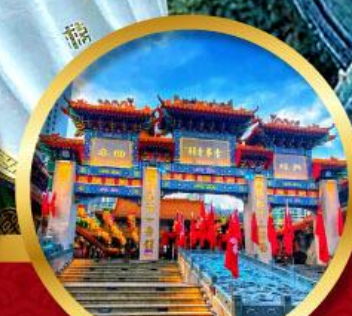
วัดหวังตักสิยาน ขอพรด้านสุขภาพ