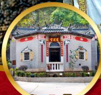
วัดหลินฟ้า โชคลาภ และ ความมั่งคั่ง