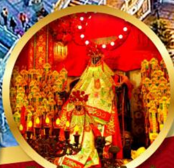
เจ้าแม่กวนอิมฮ่องอ๋า นบัสการองค์เจ้าแม่กวนอิม อายุกว่า 600 ปี