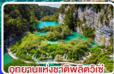
อุทยานแห่งชาติพลิตวิเช่