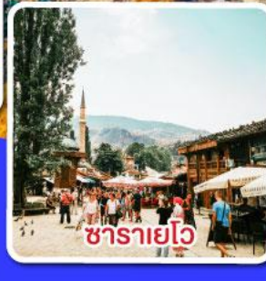
ซาดาร์โย