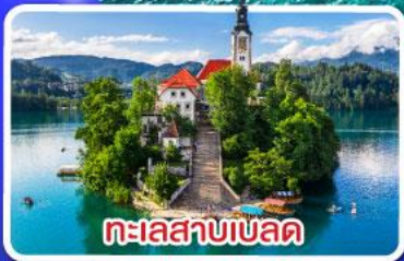
ทะเลสาบเบล็ด

ตามรอย Game of thrones ณ เมืองดูบรอฟนิก ไข่มุกแห่งแอเดรียติก พร้อมขึ้นกระเช้า SRD