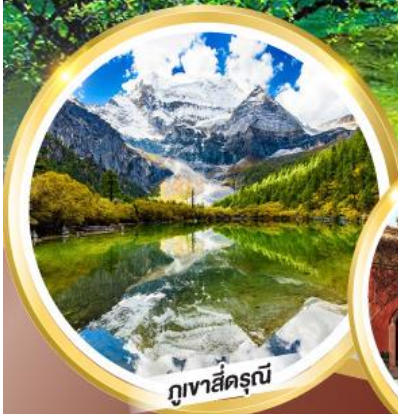
ภูเขาสีดรุณี