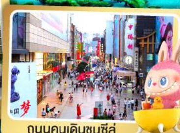
ถนนคนเดินซุนชี่ลู่