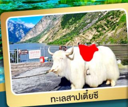
ทะเลสาปเตี้ยซี