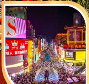
ถนนคนเดิน หวงซิงหลู่