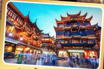
ตลาดร้อยปีเฉิงหวิงเหมียว