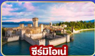
ซิริโอเน่