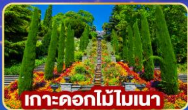
เกาะดอกไม้โมนา