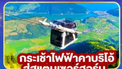
กระเช้าไฟฟ้าคาบรีโอ สู่สแตนเซอร์ฮอร์น

🍴 พิเศษ! พิชิตยอดเขาดีอาไวเลสซา พร้อมเมนูกะเพราไทย