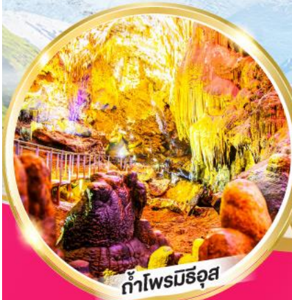
ถ้ำไฟรมิธอส