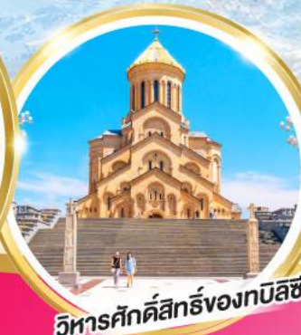
วิหารศักดิ์สิทธิ์ของทบิลีซี