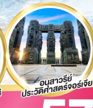
อนสาวรีย์ประวัติศาสตร์จอร์เจีย