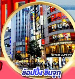
ช้อปปิ้ง ซินจูกุ