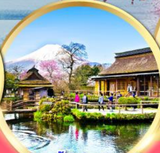
หมู่บ้านน้ำใสโอชิโนะฮักโก