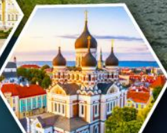
วิหารอเล็กซานเดอร์ เนฟสกี (ทาลลินน์)

• ล่องเรือซิลเลียไลน์ข้าม จากเอสโทเนียสู่ฟินแลนด์ • เข้าชมโบสถ์หิน Rock Church