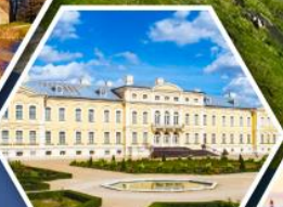
พระราชวังรินดาเล