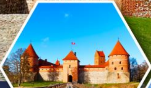
ปราสาททราไก