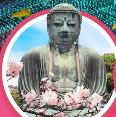
หลวงพ่อดังโตโตบุตสึ