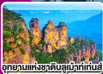
อุทยานแห่งชาติบลูเมาท์เทนส์

พิเศษ เมนูกึ่งลิบส์เตอร์กำหนดละ 1 ตัว พร้อมไวน์ชั้นเยี่ยม