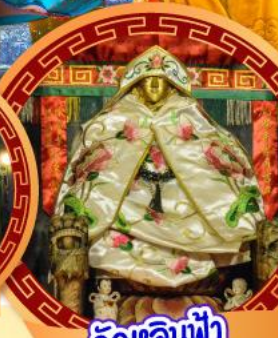
วัดเลินฟ้า