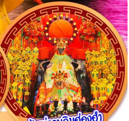
เจ้าแม่กวนอิมฮ่องอ่า

นมัสการเจ้าแม่กวนอิมฮ่องอ่า หมูนกัณฑ์รับโชคลากเงินทองที่วัดแชกงหมิว ขอพรความรักกับผู้เช่าจีนตรา วัดหวังต้าเซียน