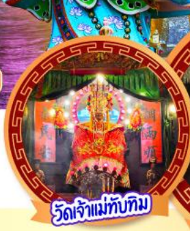
วัดเจ้าแม่ทับทิม