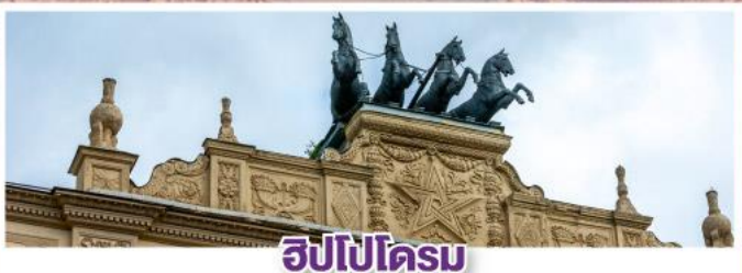
ฮิปโปโดรม