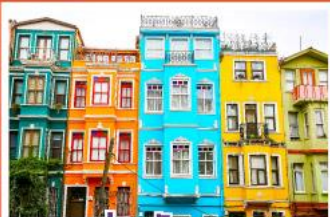
ย่านบิลลาท