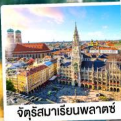
จัตุรัสมาเรียนพลาตซ์

28 ก.พ.-06 มี.ค. 68 12-18 มี.ค. / 28 มี.ค.-03 เม.ย. 68 10-16 เม.ย. / 25 เม.ย.-01 พ.ค. 68