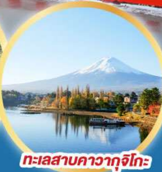
ทะเลสาบคาวากูจิโกะ