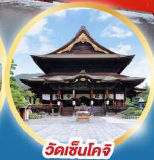
วัดเซ็นโคจิ