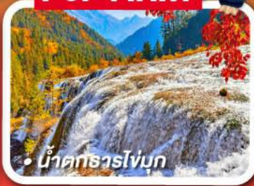
น้ำตกธารไร่มุก