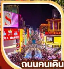
ถนนคนเดิน หวงซิงลู่