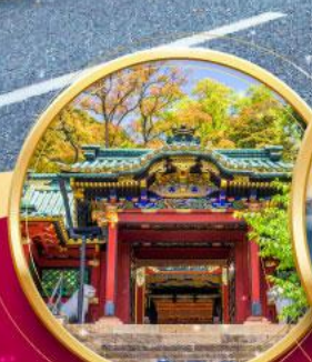
ศาลเจ้าโทโชคุ