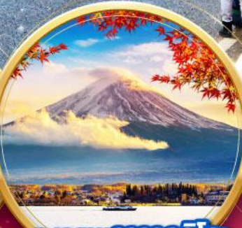
ทะเลสาบคาวากุจิโกะ